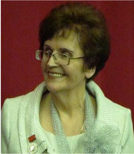
ЯШИНА Инэль Петровна (1976 – 2011 г.г.)

Поэт, член Союза писателей СССР (России) с 1985 года.